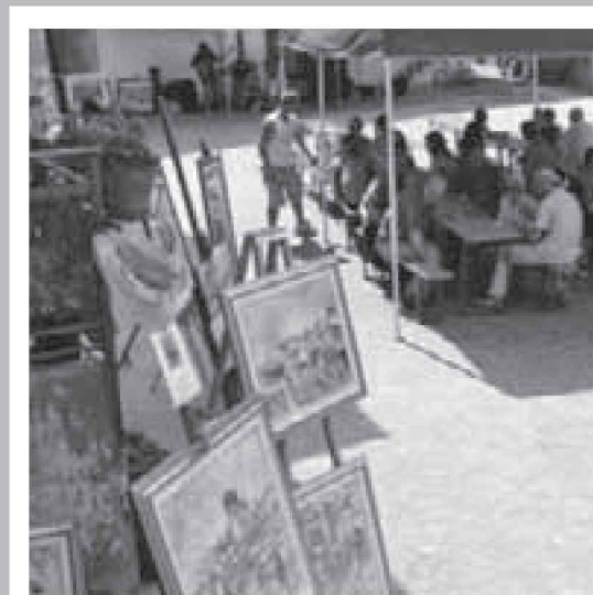
Si ringraziano per aver sponsorizzato l'evento: CASSA RURALE DELLA BASSA VALSUGANA E CASEARIA MONTI TARENTINI

La giuria si è complimentata con gli artisti presenti per la buona qualità delle opere esposte e con gli organizzatori per l'indovinata iniziativa di animazione culturale del territorio, auspicando che si ripeta anche in altri luoghi significativi della Valsugana.